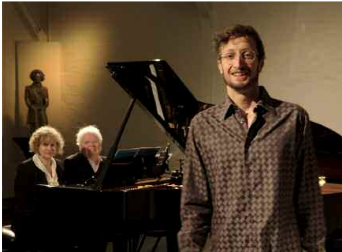
Film still from "Serenade trifft Blues", Photo Richard Haufe-Ahmels

The interpretation heard on this CD is choreographed by Geugelin's teacher Uwe Meusel, one of Europe's leading tap-dance experts, who in his classes pays great attention to pure physical dance technique as well as to musical precision.