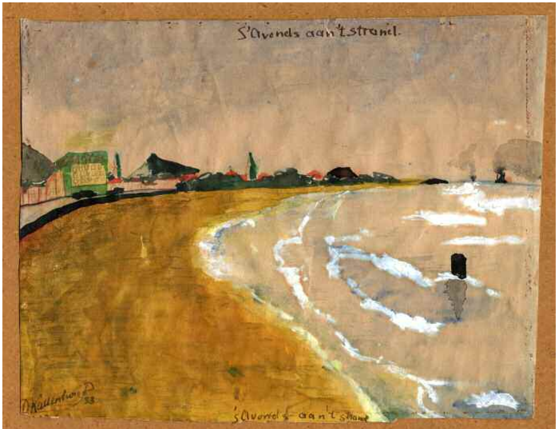
Dick Kattenburg, Watercolour "Evening on the beach" (Knokke, Belgium), 1933.