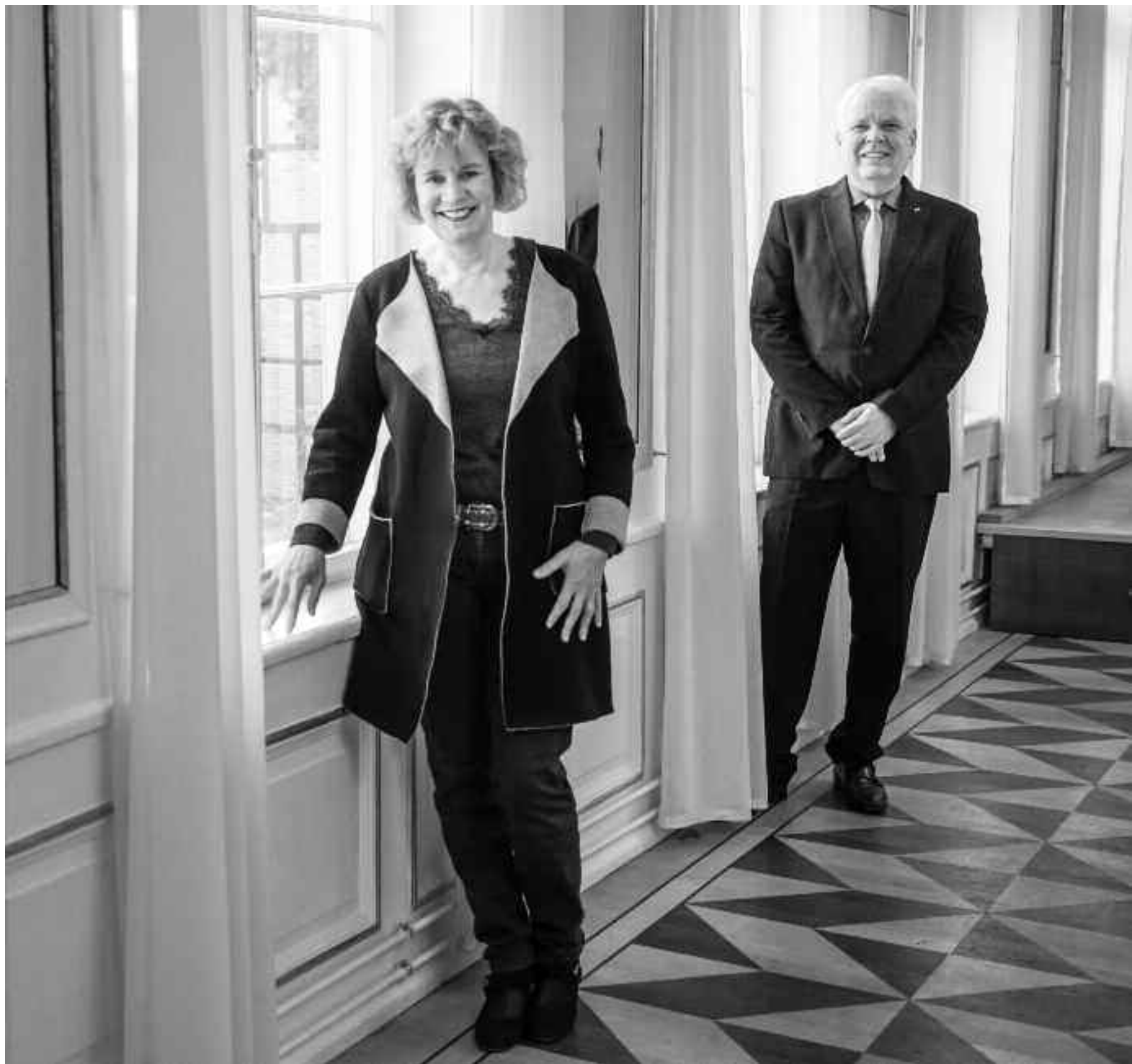
Piano Duo Friederike Haufe Volker Ahmels, Photo Oliver Borchert